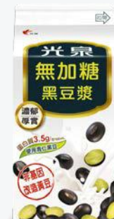
光泉無加糖黑豆漿 400ml