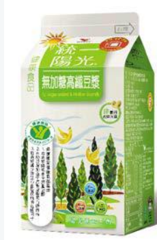
統一陽光無加糖高纖豆漿 400ml