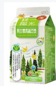
統一陽光無加糖 高纖豆漿400ml