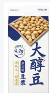
大醇豆無加糖豆漿 375ml