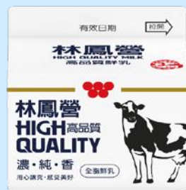
林鳳營高品質鮮乳 228ml