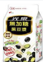
光泉無加糖黑豆漿 400ml