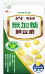
光泉無加糖鮮豆漿 400ml