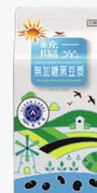
統一陽光無加糖 黑豆漿400ml