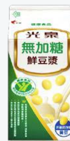
光泉無加糖鮮豆漿 400ml