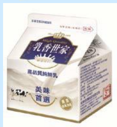
乳香世家全脂鮮乳 220ml