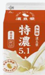
光泉無加糖濃豆漿 375ml