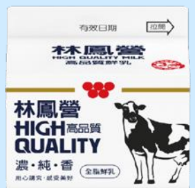
林鳳營高品質鮮乳 228ml