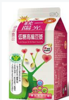
統一陽光低糖高纖豆漿 400ml