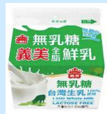
義美無乳糖全脂 鮮乳200ml