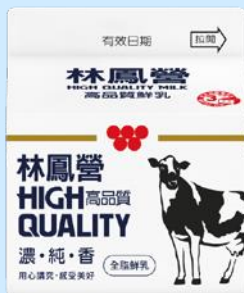
林鳳營高品質鮮 乳228ml