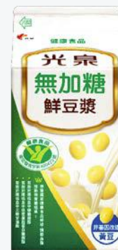
光泉無加糖鮮豆漿 400ml