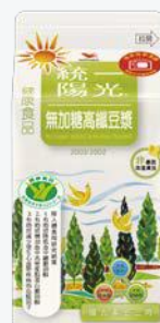
統一陽光無加糖高纖 豆漿400ml