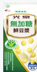
光泉無加糖鮮豆漿 400ml