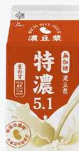
光泉無加糖濃豆漿 375ml