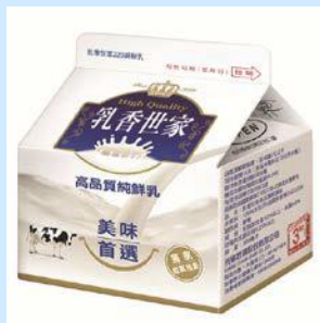
乳香世家高品質純鮮乳 220ml