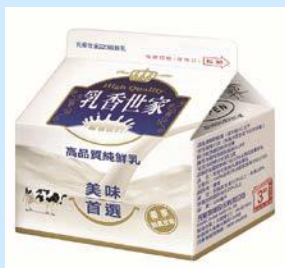
乳香世家全脂鮮乳 220ml