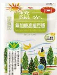
統一陽光無加糖 高纖豆漿400ml