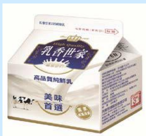
乳香世家全脂鮮乳 220ml