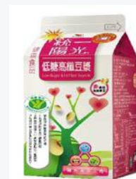
統一陽光低糖 高纖豆漿400ml