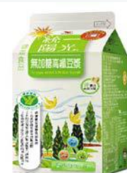
統一陽光無加糖 高纖豆漿400ml