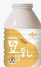
Jacksoy濃豆奶 (無糖) 330ml