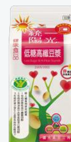
統一陽光低糖高纖 豆漿400ml