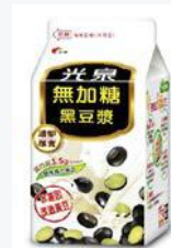
光泉無加糖 統一陽光無加 黑豆漿400ml 糖高纖豆漿 400ml