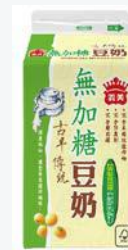
義美古早傳 統無糖豆奶 400ml