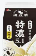
光泉無加糖濃 黑豆漿375ml