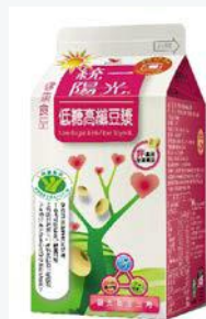
統一陽光低糖 高纖豆漿400ml