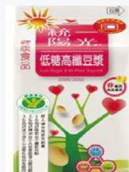
統一陽光低糖 高纖豆漿400ml